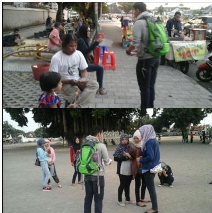
Penyebaran flyer Hijabmorfosa