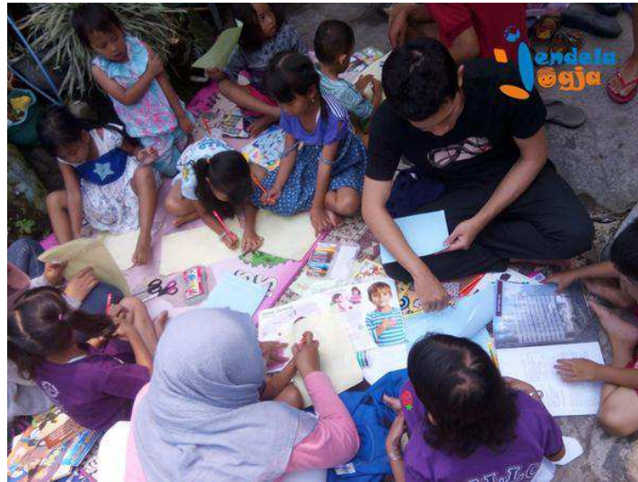
Salah satu kegiatan yang menggunakan dana kerjasama Incomm, 27 September 2015