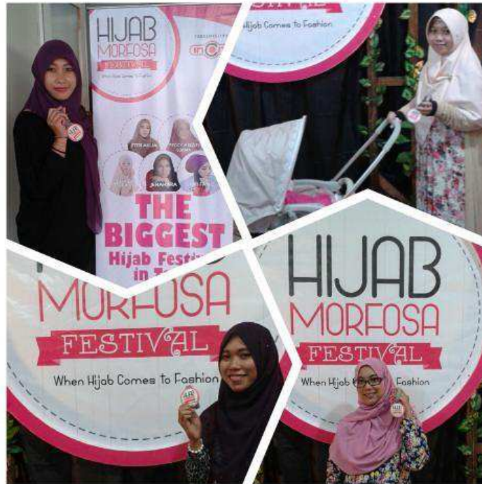
Empat Donatur Charity Hijabmorfosa