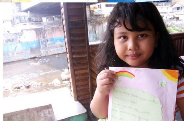
Anak-anak Kali Code Jendela Jogja. 27092015