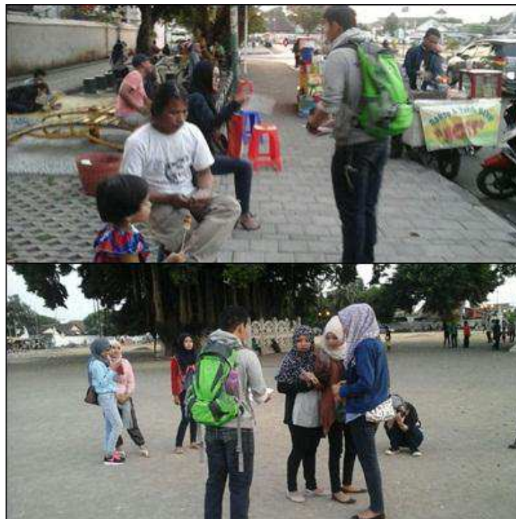
Penyebaran flyer Hijabmorfosa