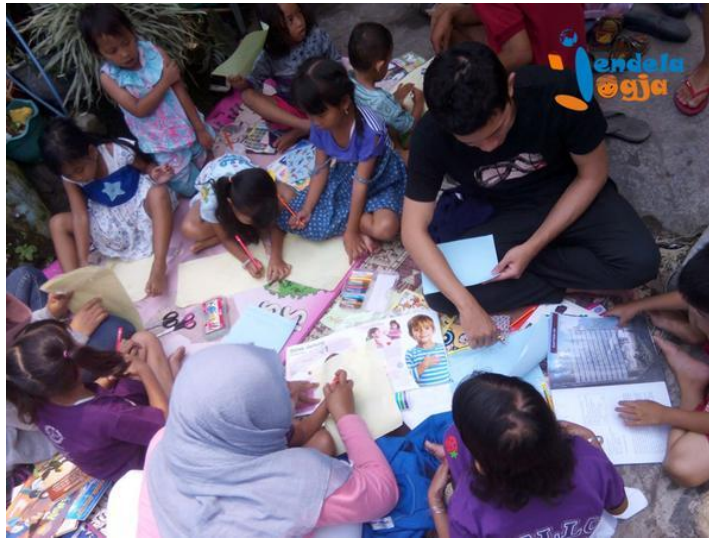
Salah satu kegiatan yang menggunakan dana kerjasama Incomm, 27 September 2015