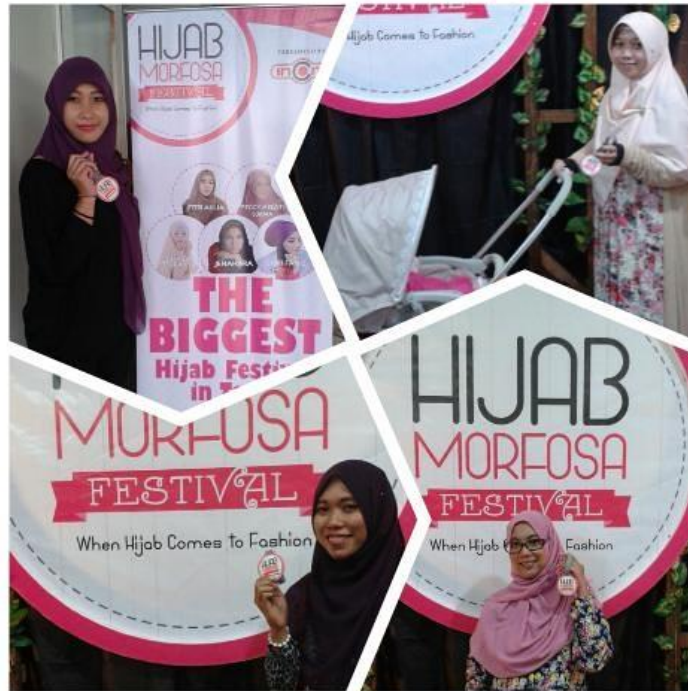
Empat Donatur Charity Hijabmorfosa