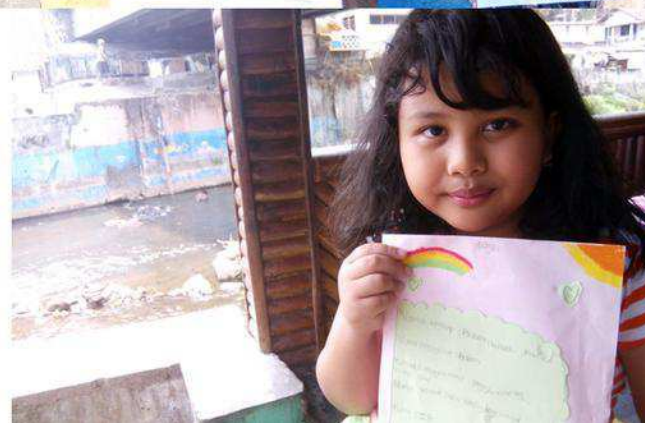
Anak-anak Kali Code Jendela Jogja. 27092015